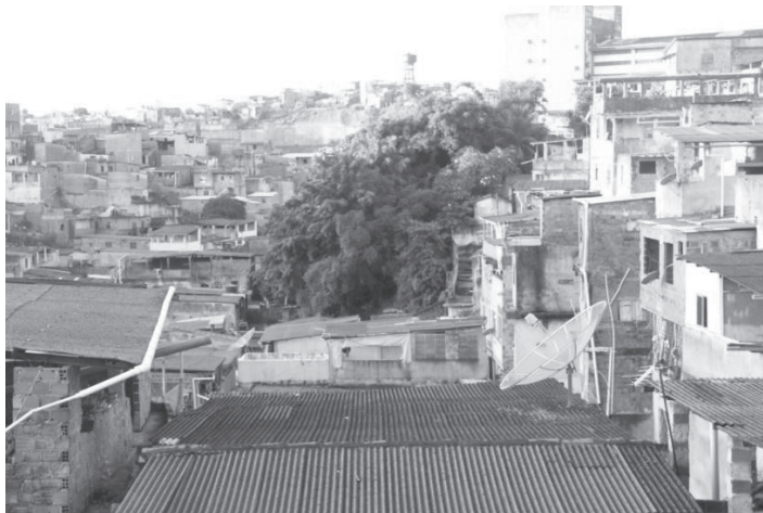
Vista de uma laje na Rua da Liberdade. A área verde corresponde ao fundo do kwe.